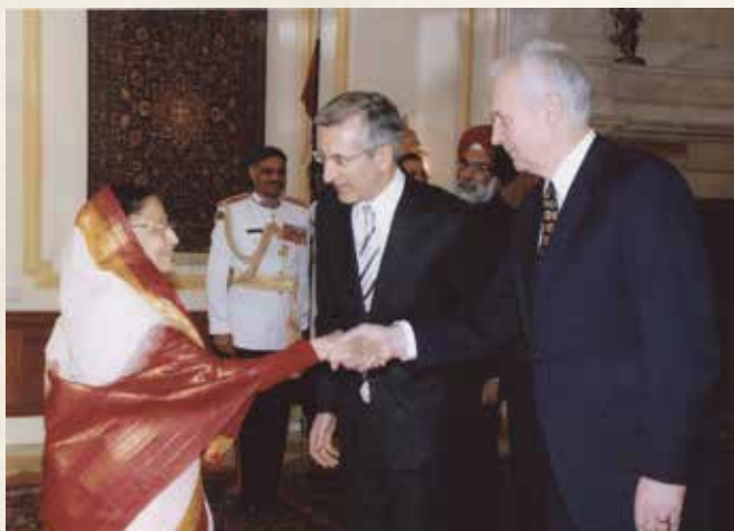
Indijos prezidentės Smt. Pratibha Devisingh Patil priėmimas prezidento rūmuose, Delis, 2009 m.