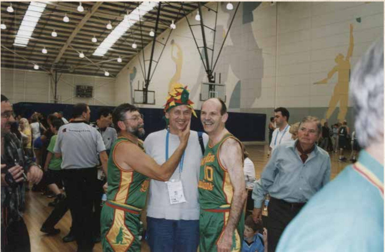
Su "Australian Lithuanians" komandos žaidėjais WMG metu, Melburnas, 2002 m.