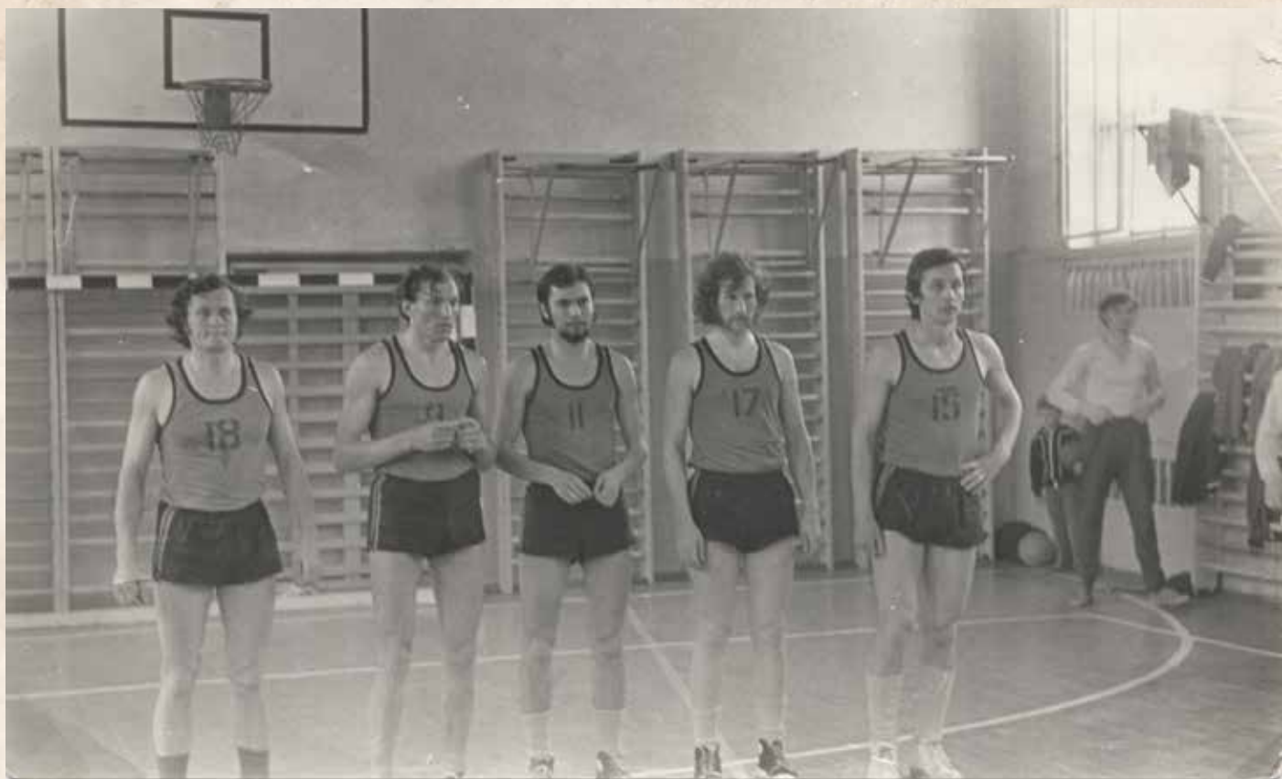
“Sakalo” komanda, Minskas, 1976 m.