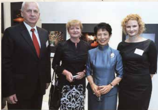
Diplomatų foto parodos atidarymo metu su Japonijos princese Takamado, Tokijas, 2012 m.