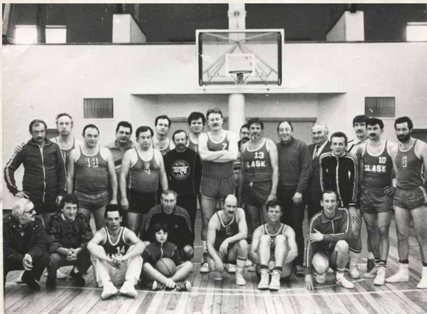
“Ūpas” komanda po susitikimo su Vroclavo “Šlask”, Vilnius, 1988 m.