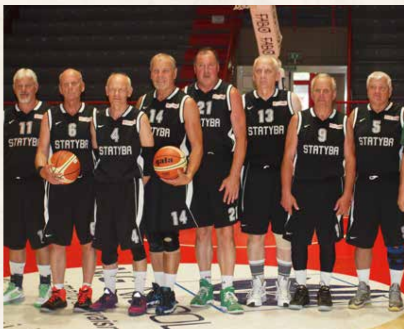
SC Vilniaus Statybos Senjorai komanda, užėmusi antrąją vietą FIMBA pasaulio čempionato M65+ grupėje, Montecatini, Italija, 2017 m.