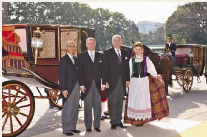
Prieš susitikimą su Japonijos Imperatoriumi Akichito, Tokijas, 2012 m.