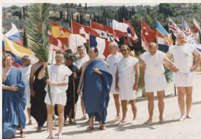
Bėgimo rungties dalyviai restauruotame senovės olimpiados stadione, Nemėja, 2000 m.