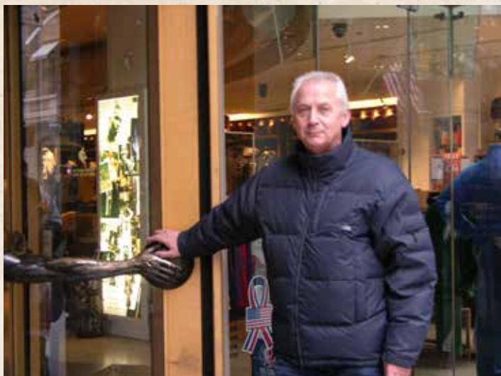
NBA parduotuvė 5th Avenue, Niujorkas, 2006 m.