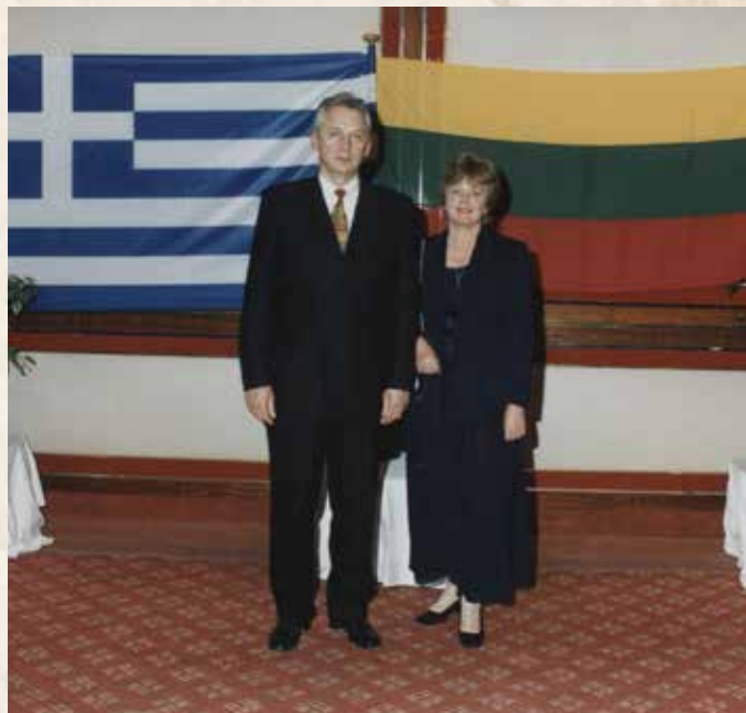
Belaukiant svečių priėmimo Nepriklausomybės dienos proga, Atėnai, 1999 m.