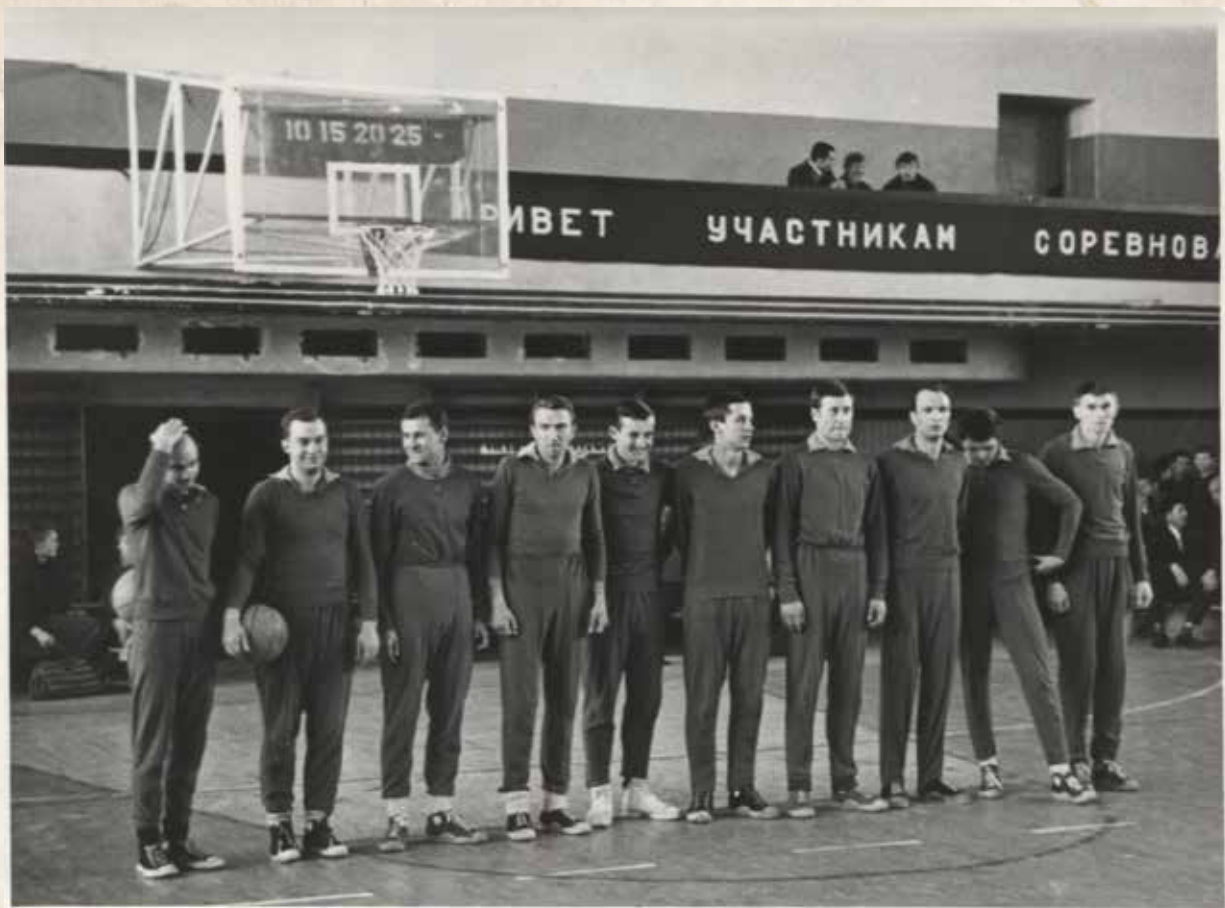
“Mokslo” komanda- “Žalgirio” draugijos čempionas, Klaipėda, 1968