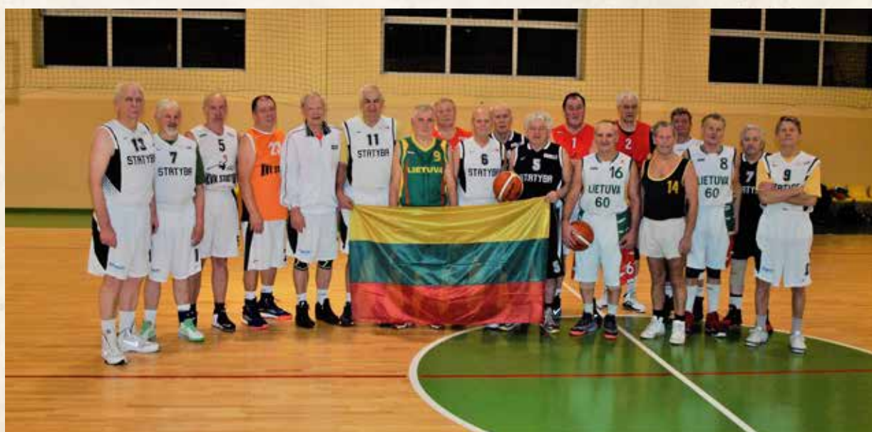
SC Vilniaus Statybos Senjorai žaidėjai po naujametinio krepšinio turnyro, Vilnius, 2018 m.