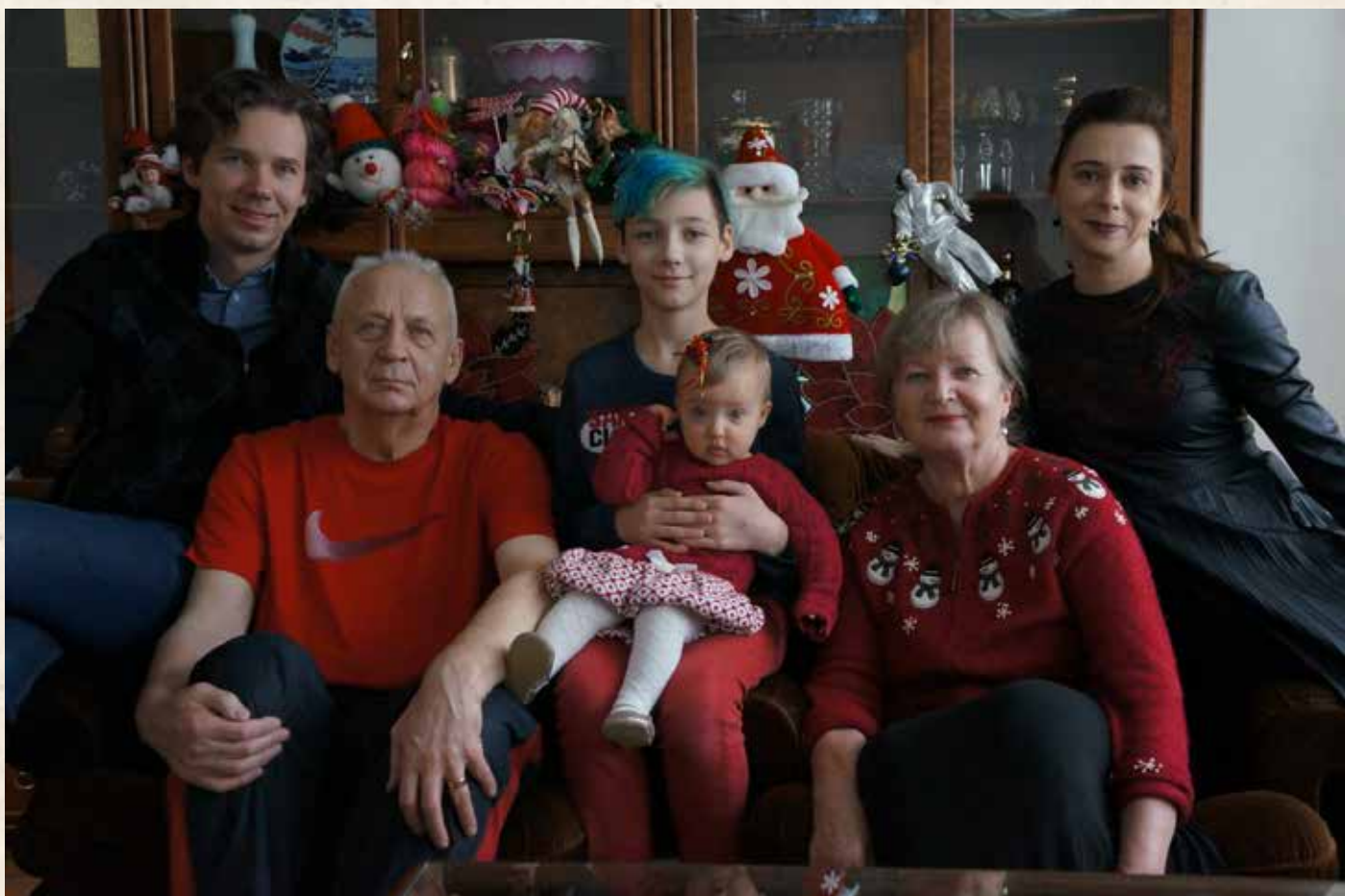
Kalėdos, Vilnius, 2018 m.