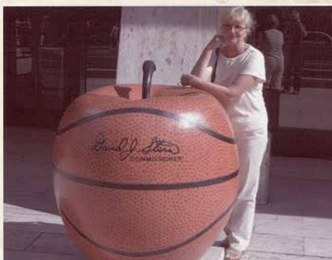
Virginija prie NBA Niujorke akcento- oranžinis kamuolys- obuolys, 2005 m.