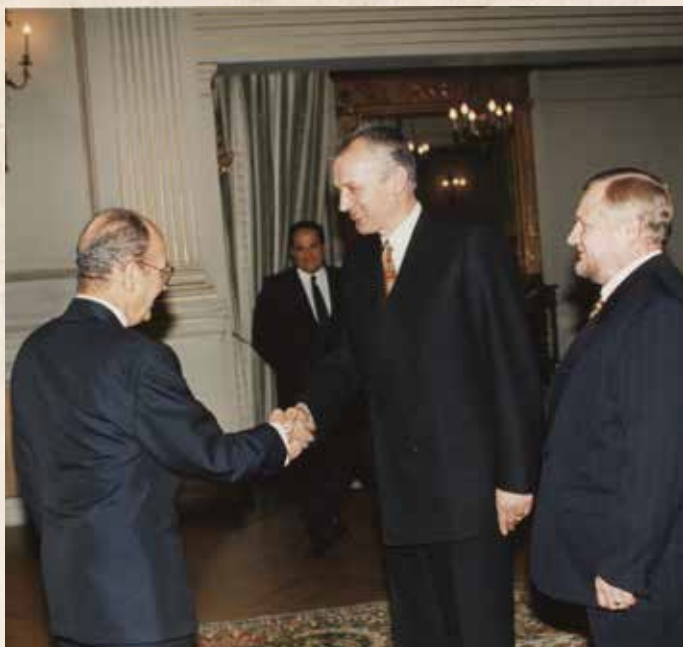
Graikijos prezidento Costis Stephanopoulos priėmimas prezidentūros rūmuose, Atėnai, 1998 m.