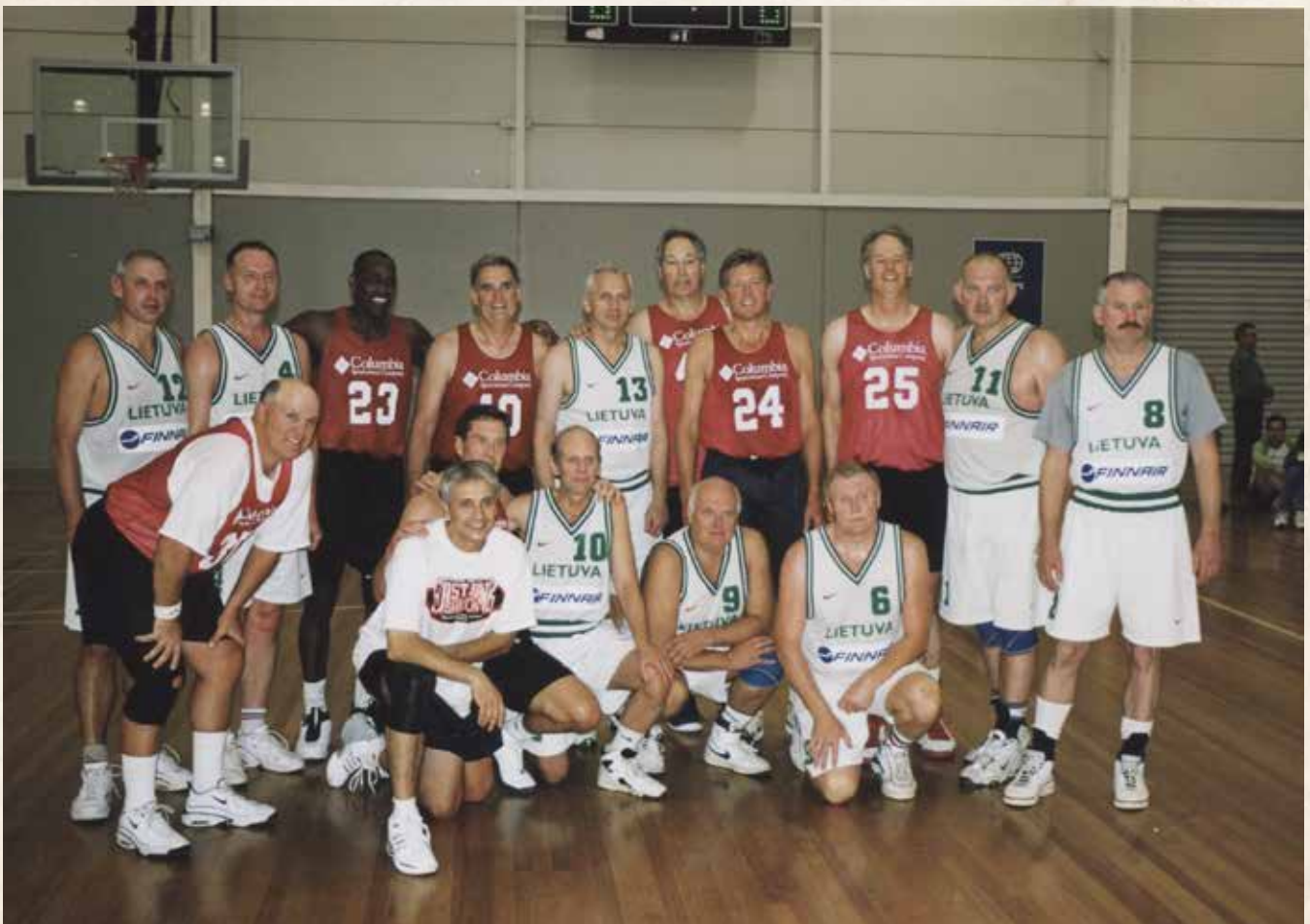
Po varžybų su Portlendo "East Bank Saloon" komanda WMG, Melburnas, 2002 m.