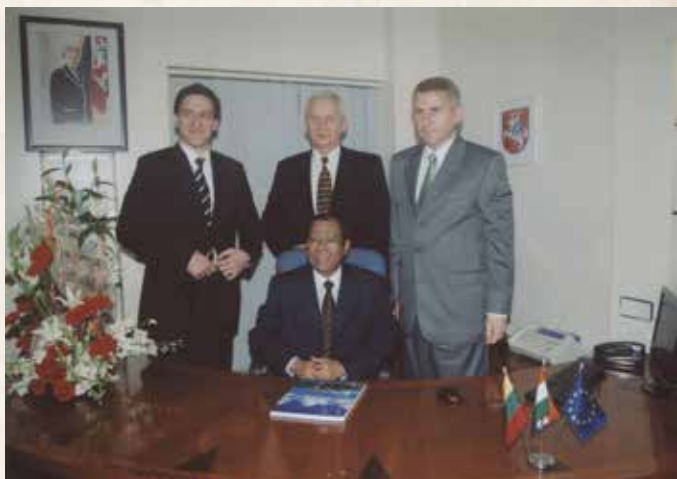
Lietuvos Respublikos konsulato Mumbajuje atidarymas, 2009 m.