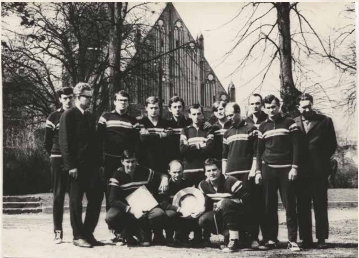
“Mokslo” komanda- tarptautinio krepšinio turnyro nugalėtoja, Greifswaldas (VDR), 1969 m.