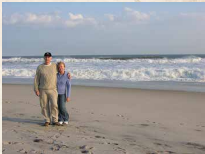
Prie Ramiojo vandenyno