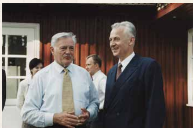
Su Lietuvos Respublikos Prezidentu Valdu Adamkumi Baltijos jūros valstybių vadovų susitikimo metu, Nida, 2003 m.