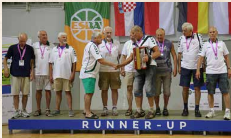
ESBA čempionato M65+ antros vietos SC Vilniaus Statybos Senjorai apdovanojimas, Poreč, Kroatija, 2016 m.