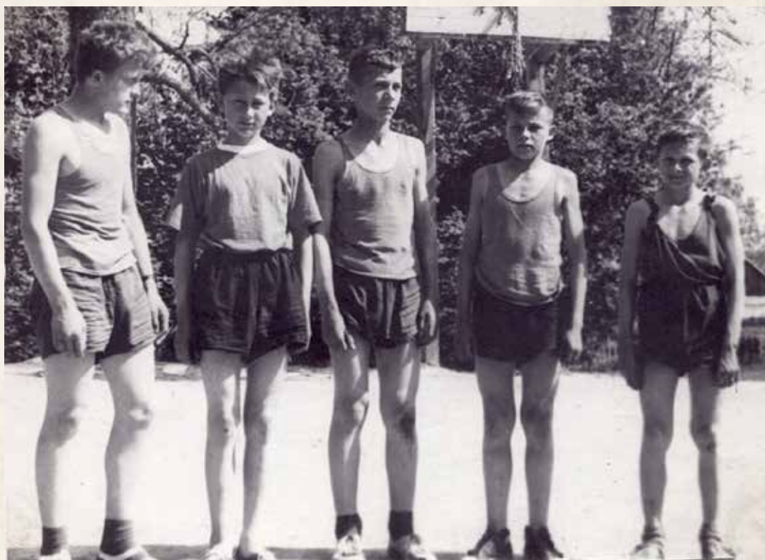
Septintos klasės krepšinio komanda, 1963 m.