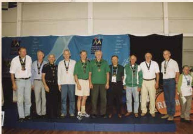
Lietuvos komanda WMG M55+ grupės prizininkė, Melburnas, 2002 m.